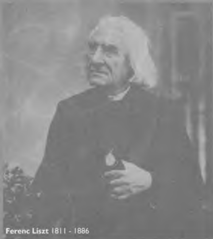
Ferenc Liszt 1811 - 1886

Jest honorowym obywatelem miast Jelenia Góra, Kłodzko, Frombork, Polanica Zdr. przyznanych za zasługi w popularyzowaniu kultury . Jest konsultantem i autorem licznych projektów w zakresie budownictwa organowego w Polsce /m.in. Bazylika w Licheniu, Kościół Wszystkich Świętych w Warszawie/ w Niemczech, Kanadzie i Japonii.