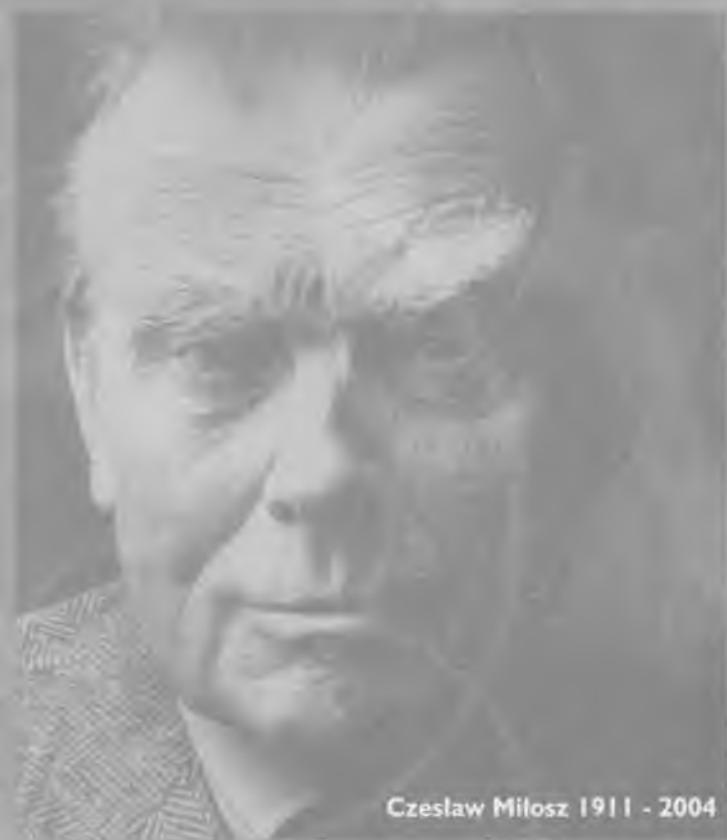
Czesław Miłosz 1911 - 2004

„Stojąc na płytach chodnika przy wejściu do Hadesu Orfeusz kulił się w porywistym wietrze, Który targał jego płaszczem, toczył kłęby mgły, Miotał się w liściach drzew. Światła aut: Za każdym napływem mgły przygasaly.