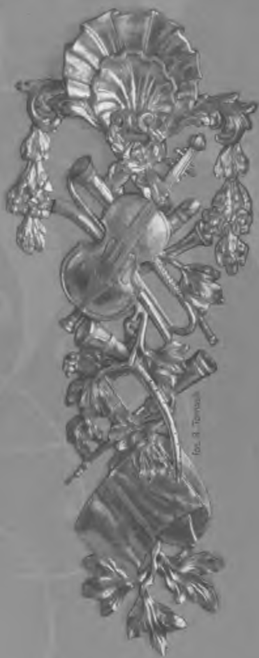
Fig. 9. Torment