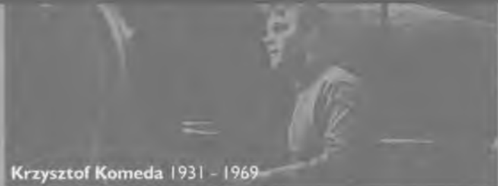
Krzysztof Komeda 1931 - 1969